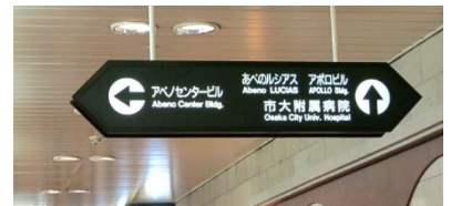
出口13付近にある誘導表示 地下道でB地点まで行く場合は この表示の下を通過して 地下道を奥へ進みます