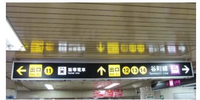
出口11付近にある誘導表示