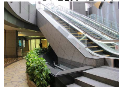
あべのルシアスの地下広場から エスカレーター、階段、 エレベーターを使って 地上へ上がります