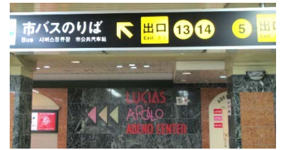
出口5付近にある誘導表示