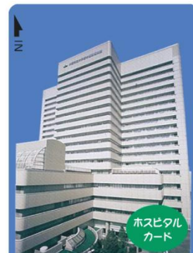
病床テレビ・病棟洗濯室 6Fレストラン カメリア でご使用いただけます